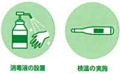
消毒液の設置 検温の実施

(ご注意) ・この用紙は、機械で処理しますので、金額を記入する際は、枠内にはっきりと記入してください。また、本票を汚したり、折り曲げたりしないでください。 ・この用紙は、ゆうちょ銀行又は郵便局の払込機能付きATMでもご利用いただけます。 ・この払込書を、ゆうちょ銀行又は郵便局の渉外員にお預けになるときは、引換えに預り証を必ずお受け取りください。 ・この用紙による、払込料金は、ご依頼人様が負担することとなります。 ・ご依頼人様からご提出いただきました払込書に記載されたおとところ、おなまえ等は、加入者様に通知されます。 ・この受領証は、払込みの証拠となるものですから大切に保管してください。